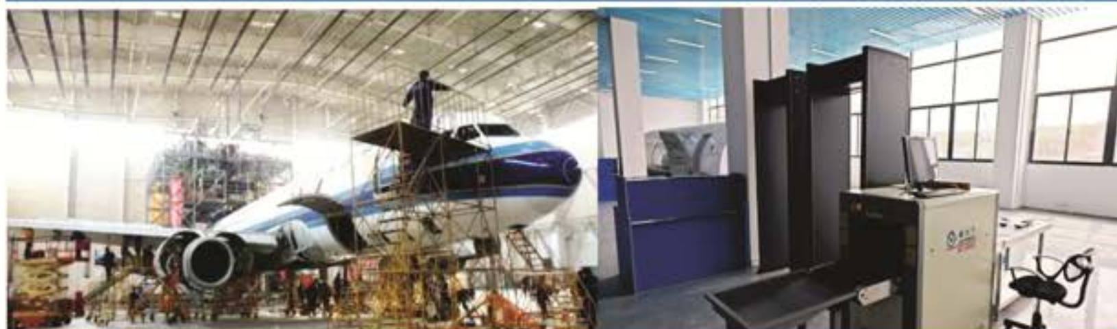
飞机机电设备维修实训场