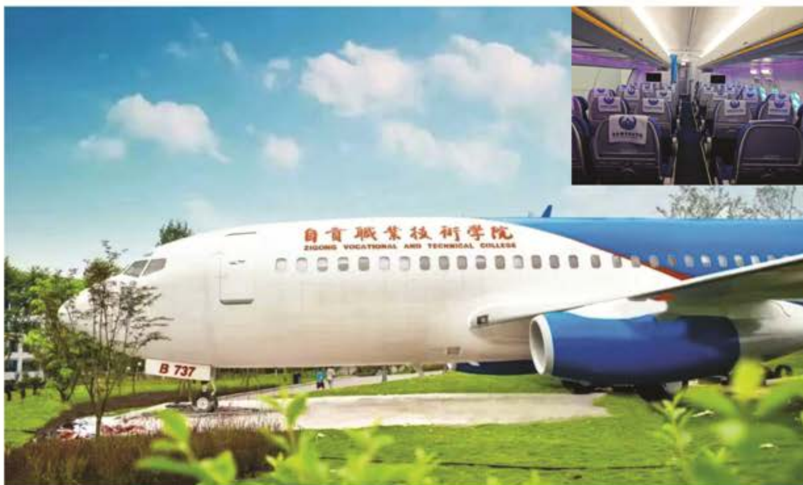
民航运输服务实训真机

Display of some training rooms on campus