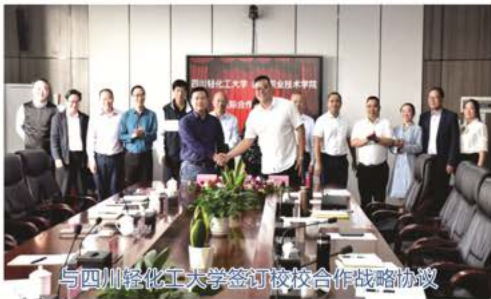
与四川轻化工大学签订校校合作战略协议