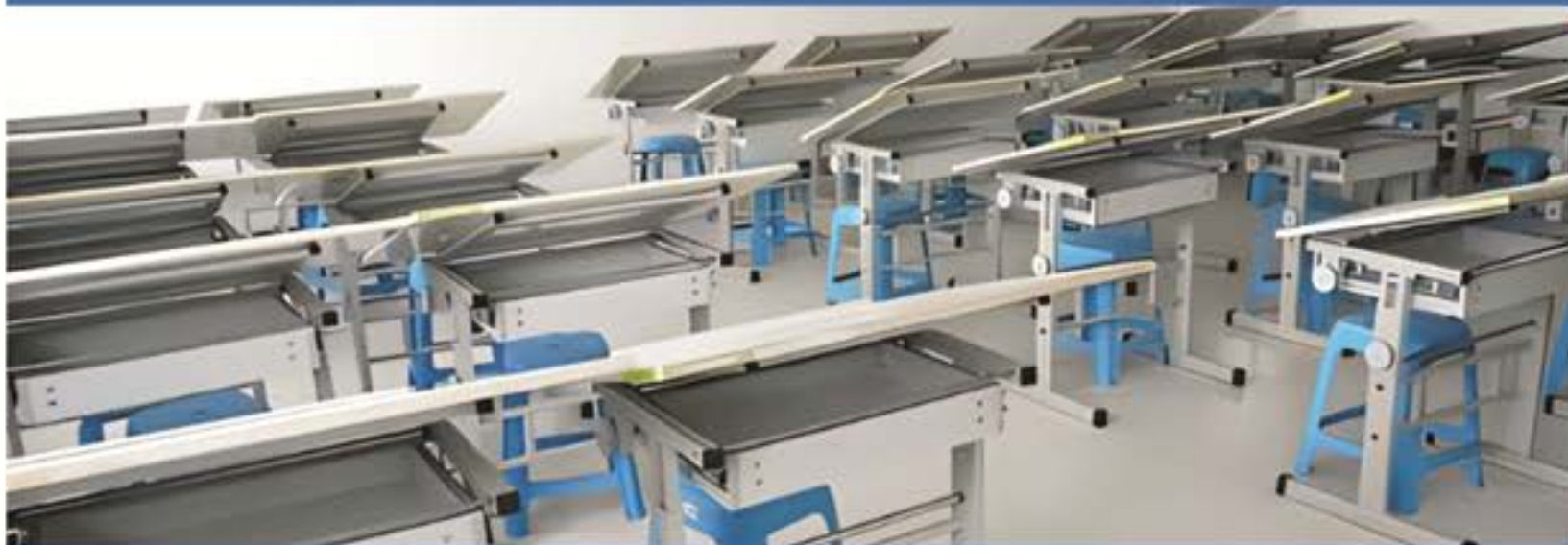
建设工程管理实训场