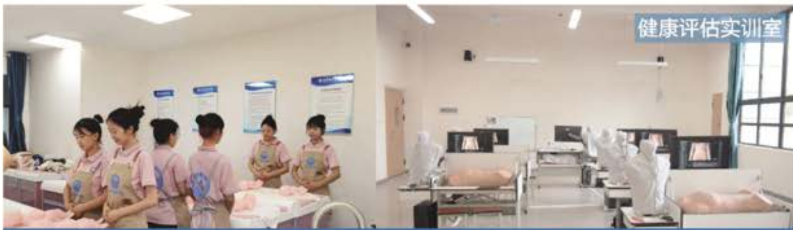
婴幼儿托育实训场